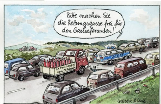
Deutschland rückt zusammen