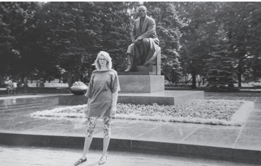
Abb. 2: Der erste Besuch der Autorin in Moskau 1992 verlief klassisch: Kreml, Lenin-Mausoleum und dann das Foto mit dem großen Revolutionsführer.